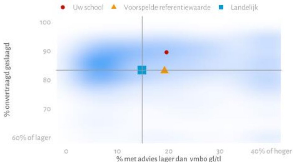
Figuur 4.1 Relatie kansen en rendement: Percentage leerlingen met een advies lager dan vmbo gl/tl ten opzichte van het percentage onvertraagd geslaagden, gemeten vanaf leerjaar 3, voor de samengevoegde instroomcohorten 2017/2018, 2018/2019 en 2019/2020 13

In figuur 4.1 uit dezelfde NCO rapportage blijkt dat onze school zich kenmerkt door een percentage leerlingen met een lager dan vmbo gl-/tl-advies dat hoger ligt dan het landelijk gemiddelde en een percentage onvertraagd geslaagde leerlingen dat hoger ligt dan het landelijk gemiddelde. Met betrekking tot het percentage leerlingen met een lager dan vmbo gl-/tl-advies, scoort onze school ongeveer even hoog als de voorspelde referentiewaarde. Qua percentage onvertraagd geslaagden scoort onze school hoger dan de voorspelde referentiewaarde.